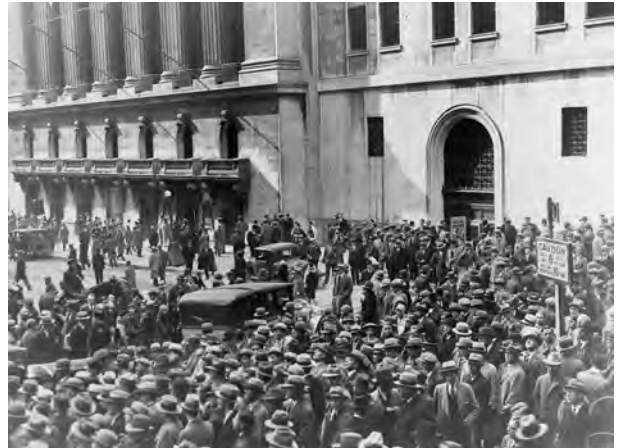
B – Multidão de investidores defronte da Bolsa de Nova Iorque, na sequência do crash bolsista.