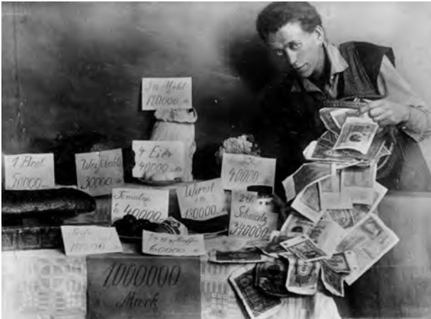
A – Preços de alimentos em milhões de marcos, durante a hiperinflação alemã.