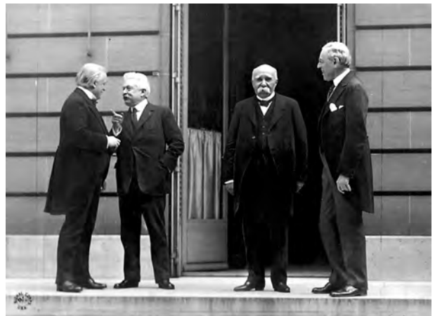
D – O presidente norte-americano Woodrow Wilson, à direita, na Conferência de Paz, em Paris.