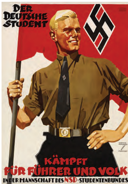
C – Cartaz de propaganda do Terceiro Reich: «O estudante alemão luta pelo Führer e pelo Povo».